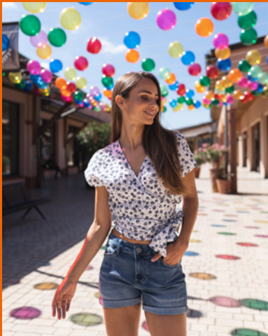
Expérience de visite renforcée