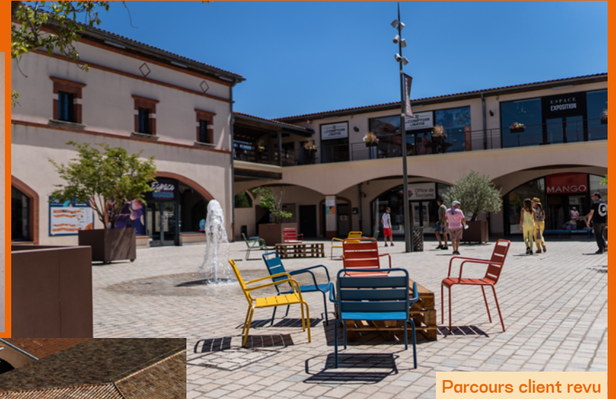
Parcours client revu